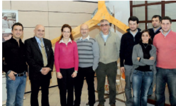
DEBUTTO La squadra della cooperativa In-Presa di Carate pronta a sperimentare il valore della formazione in un settore trainante